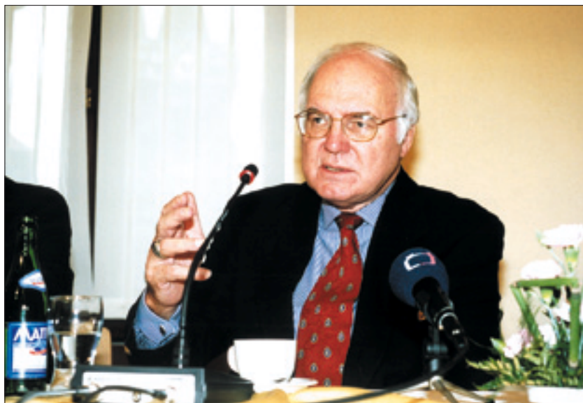
Záběry z tiskové konference po udělení Výroční ceny Liberálního institutu 2001.