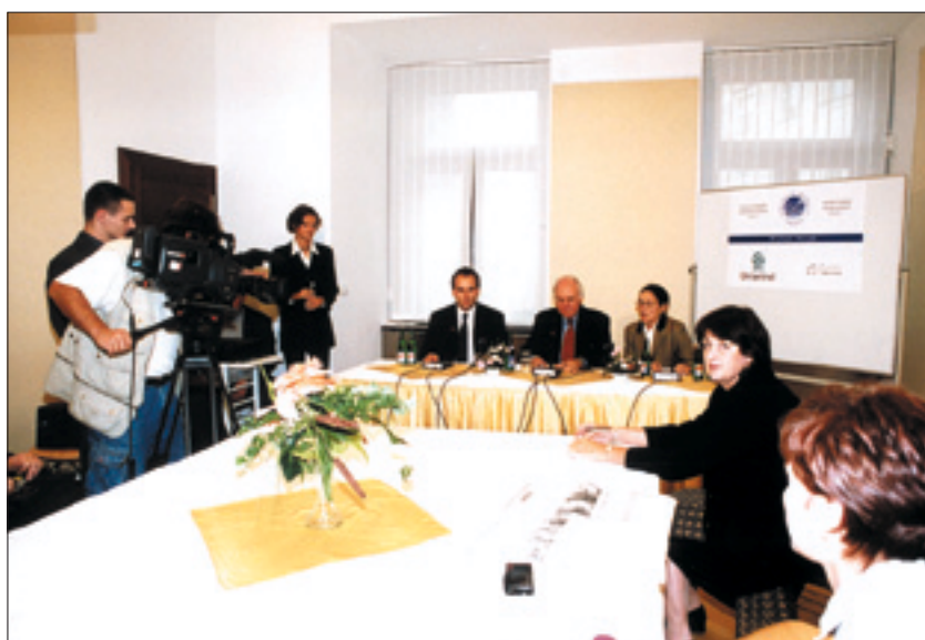
Záběry z tiskové konference po udělení Výroční ceny Liberálního institutu 2001.