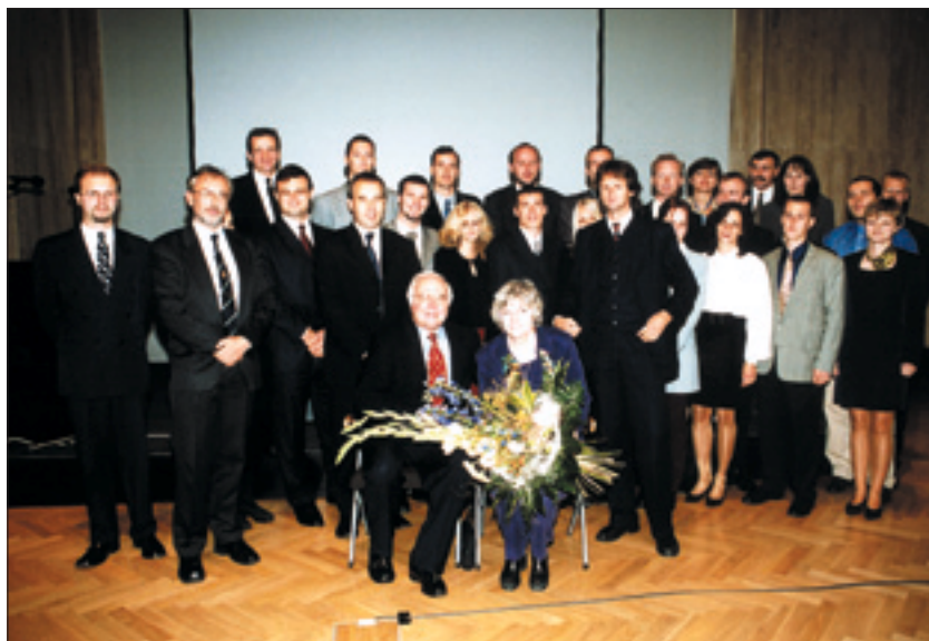
Michael Novak s manželkou mezi pracovníky a příznivci Liberálního institutu.