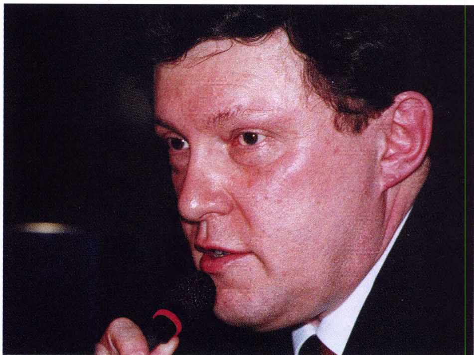
• Grigorij Javlinskij odpovídá na otázky