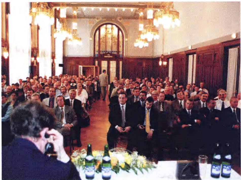
• Při Výroční přednášce ve Sladkovského sále v Obecním domě v Praze