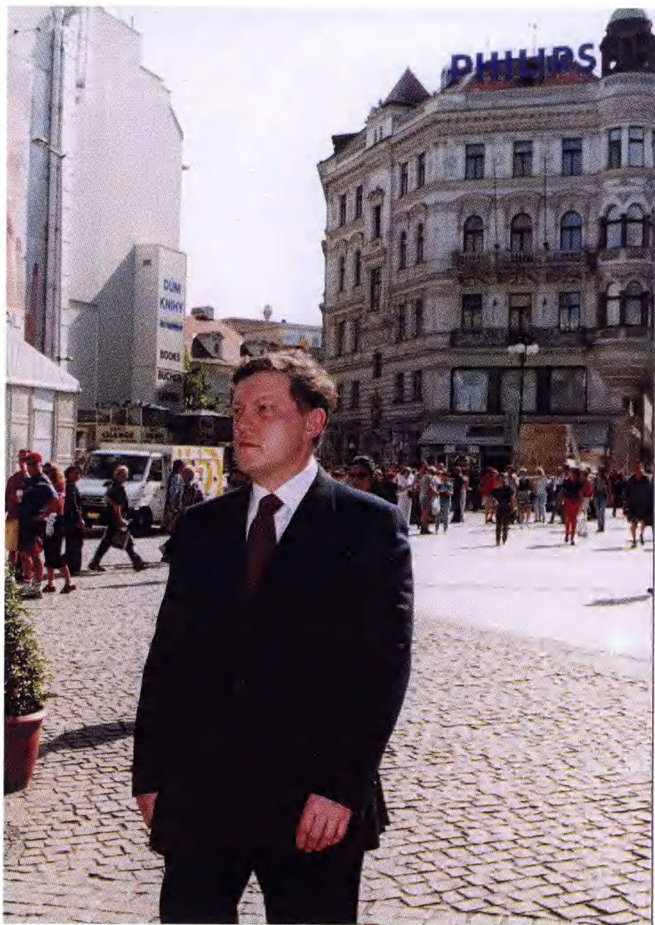
• Grigorij Javlinskij na Minsku