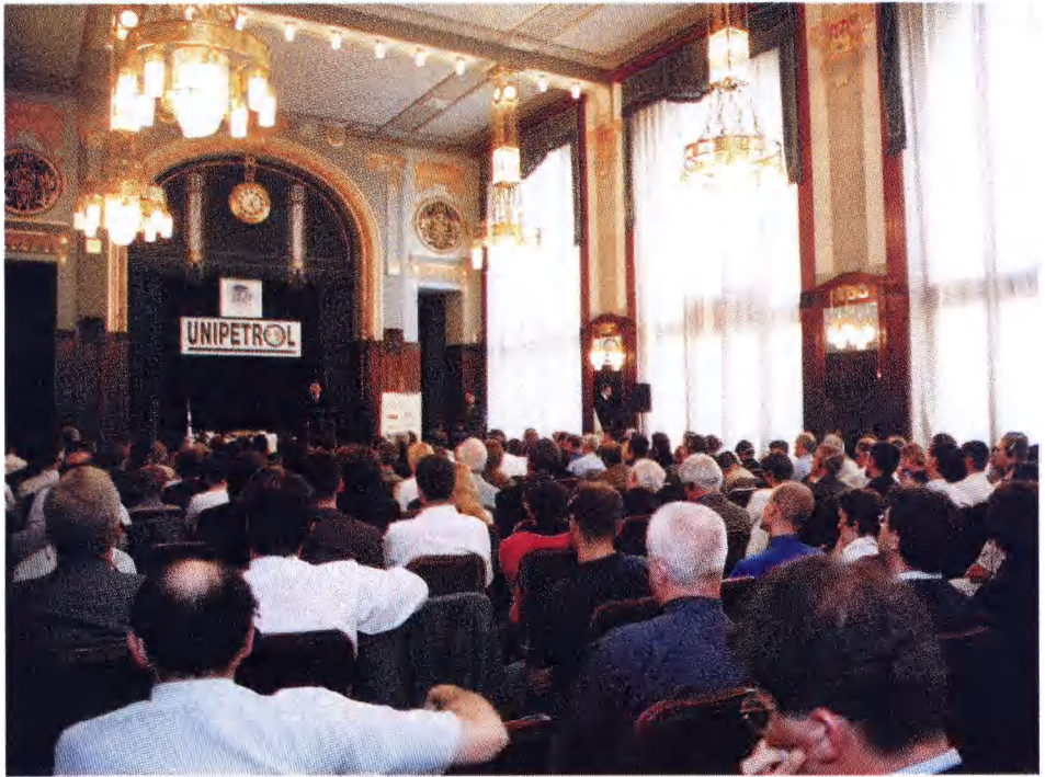
• Zaplněný Sladkovského sál při Javlinského přednášce