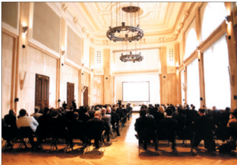
Zaplňené Kongresové centrum České národní banky při projevu Michaela Novaka.